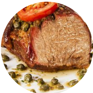
Copa lombo ao molho de alcaparras