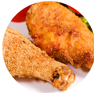
Coxa de frango empanada